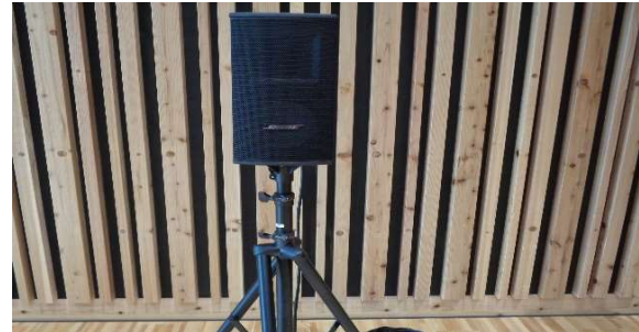
(4)有線マイク用スピーカー