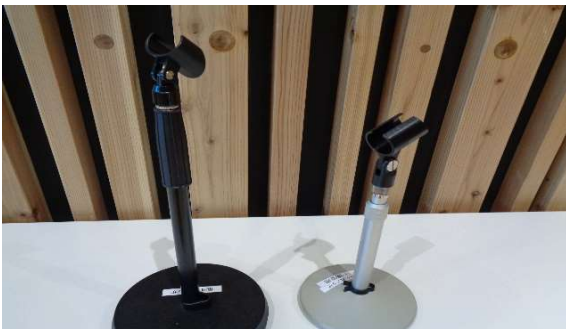
(5)卓上マイクスタンド(右JVC 左K&M)