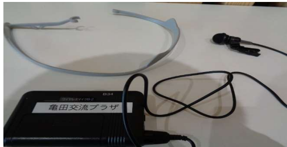
(2)ワイヤレスピンマイク