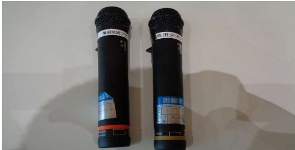
(1)ワイヤレスハンドマイク